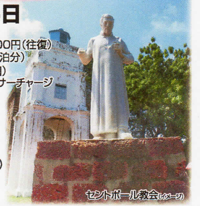
セントポール教会 (イメージ)