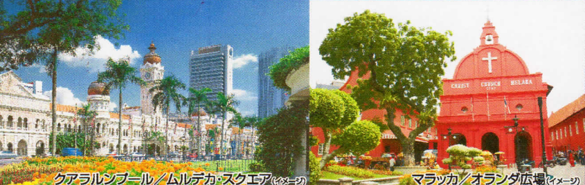
クアラルンプール/ムルデカ・スクエア (イメージ)