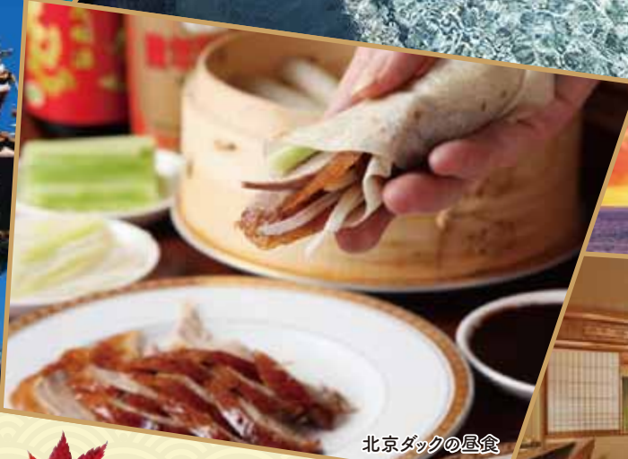
北京ダックの昼食